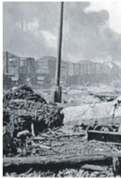
IMMENSO BOATO Una grande colonna di fumo sovrastò tutta l'area portuale e una pioggia di nafta detriti e pezzi di vetro raggiunse le aree periferiche della città

Tra i più catastrofici eventi del secondo conflitto mondiale si verificò il 9 aprile del 1945. Cancellò una categoria di lavoratori