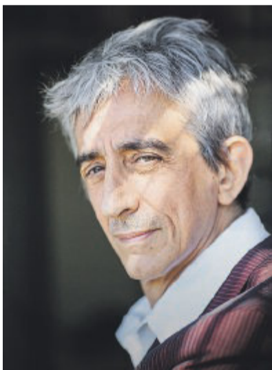
OSPITE SPECIALE Sergio Rubini

rico di ordigni saltato in aria in un contesto urbano densamente popolato. Il riserbo delle autorità alleate su tutta la vicenda e sulle cause della deflagrazione potrebbe connettersi all'impiego di nuove armi (bombe incendiarie ad alto potenziale). La versione ufficiale su quell'esplosione fu quella dell'incidente. Tuttavia nel 1946 una speciale commissione dell'U.S. Army diresse tutte le operazioni di recupero del pericoloso carico e di localizzazione dei fondali a largo della costa pugliese per «il gettito in mare di queste bombe considerate troppo pericolose per essere conservate a terra o maneggiate come necessario per scopi di demilitarizzazioni». Il capoluogo pugliese dopo l'armistizio ebbe una funzione rilevante come retrovia, con i suoi porti ed aeroporti, nel sostegno alla lotta di liberazione nazionale. Un attento testimone di quelle vicende, il giornalista Michele Lomaglio, in occasione del primo anniversario dello scoppio della nave, scrisse: «Nessuno potrà affermare che Bari non abbia sofferto a causa della guerra. Bari come tutte le città d'Italia ha il suo calvario, le sue sofferenze il suo scompiglio ha - insomma - il triste capitolo della sua storia, scritto in quest'ultima terribile guerra».